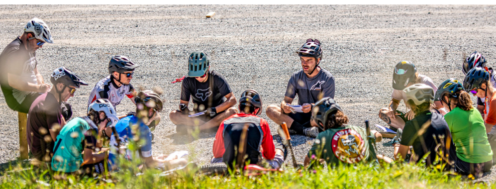
Diskussion in der Runde: Das Erlebte wird reflektiert und besprochen.

Mit dem Programm 1418coach wird der Leiternachwuchs schon früh gefördert. 14- bis 18-Jährige werden an erste Leitertätigkeiten herangeführt, übernehmen Mitverantwortung und agieren als Hilfsleitende. Personen mit einer J+S-Leiternachwuchs können Kinder und Jugendliche (5- bis 10-Jährige) leiten. Swiss Cycling Guides sind für das kommerzielle Guiding und zum Un-